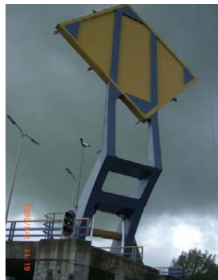
Die etwas andere Ansicht der Fliegenklatsche!