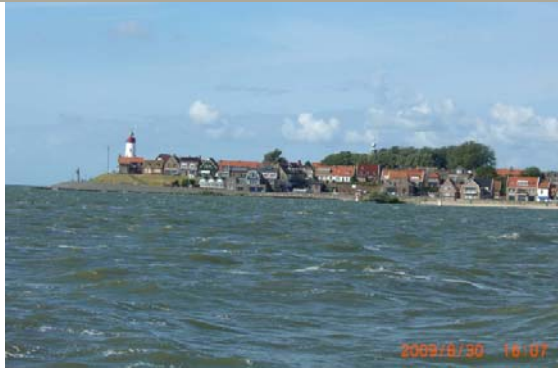
Ankunft in URK