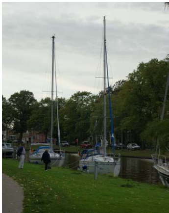
Der Stadthafen von Leeuwarden